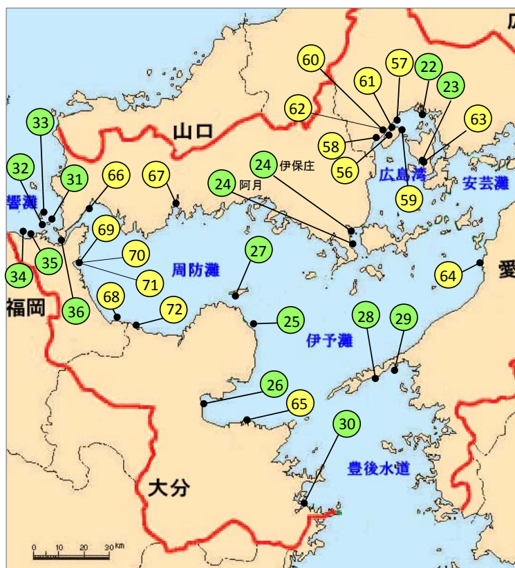
図9-2 藻場・干潟の保全の取り組み事例の実施場所