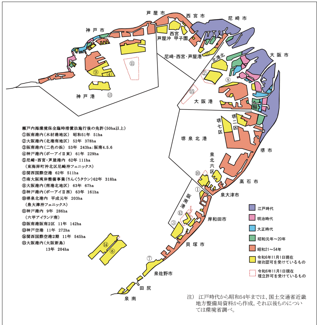
図 3-3 大阪湾奥部における埋立状況