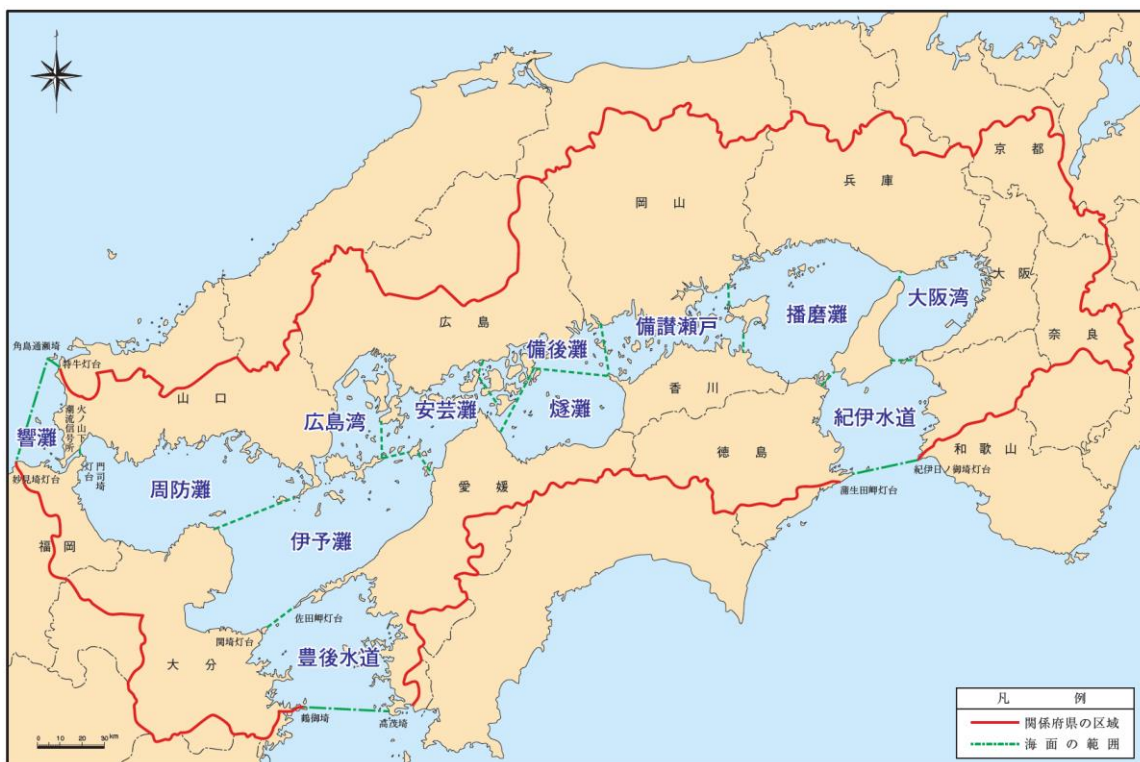
図 1-3 広域総合水質調査による湾・灘区分