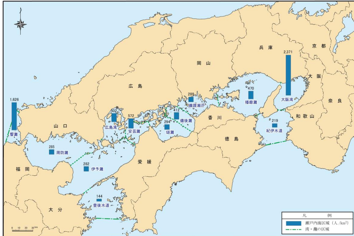
図1-15(1) 関係13府県の人口密度分布(府県別)

注) 1. 瀬戸内海区域は、「瀬戸内海環境保全特別措置法」の対象区域。 2. 湾・灘の区分は「瀬戸内海環境保全臨時措置法第13条第1項の埋立についての規定の運用に関する基本方針について」に準ずる。 3. 瀬戸内海環境保全特別措置法対象市町村における値。