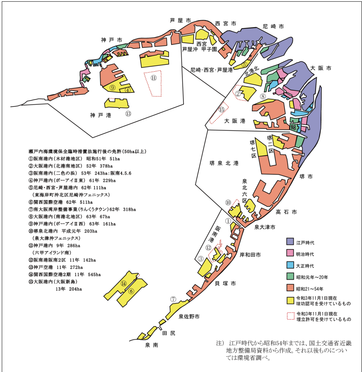
図 3-3 大阪湾奥部における埋立状況