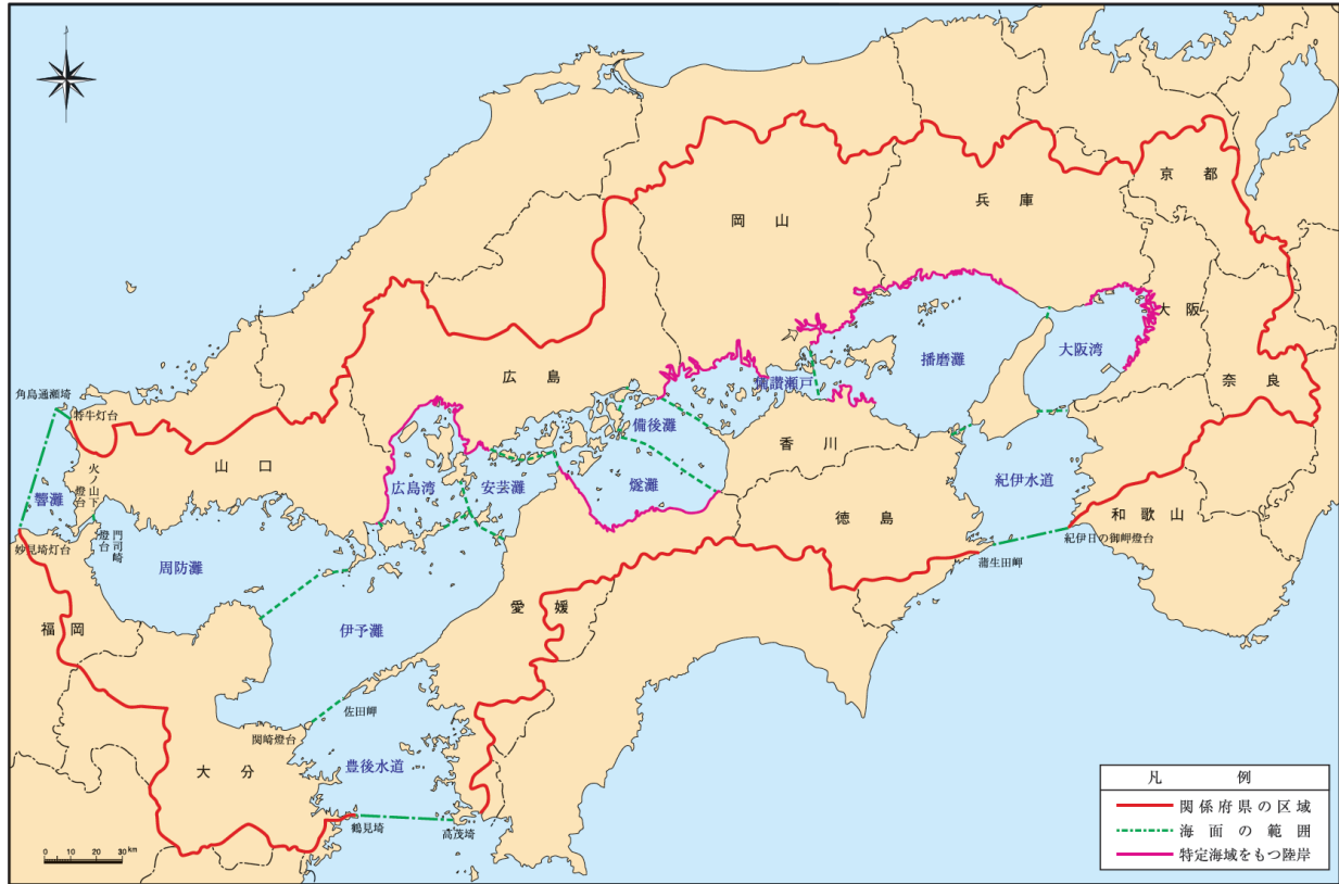
別 図 特定海域

注) 湾・灘の区分は「瀬戸内海環境保全臨時措置法第13条第1項の埋立についての規定の運用に関する基本方針について」に準ずる。