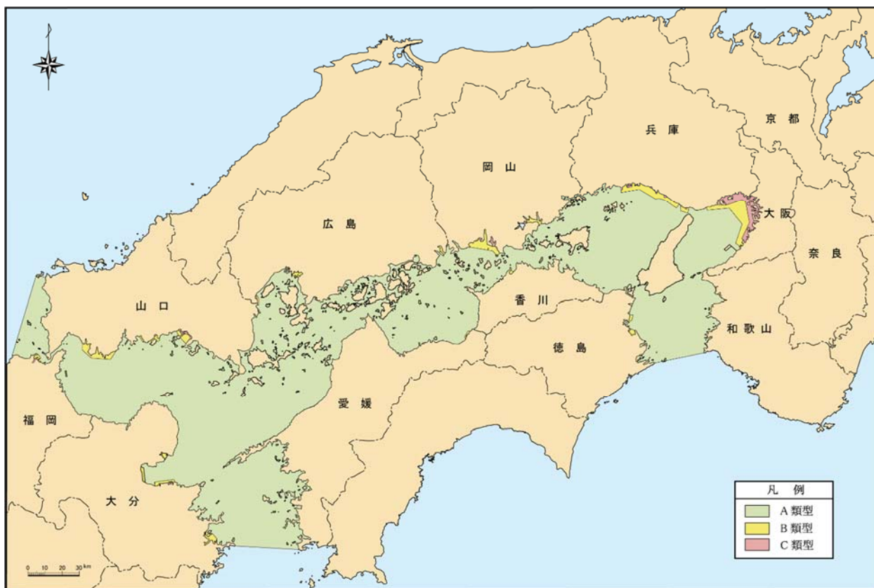
図 4-1 瀬戸内海におけるCODに係る環境基準類型指定状況