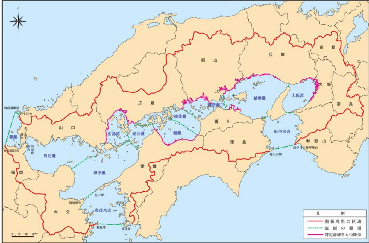
別 図 特定海域

注) 湾・灘の区分は「瀬戸内海環境保全臨時措置法第13条第1項の埋立についての規定の運用に関する基本方針について」に準ずる。