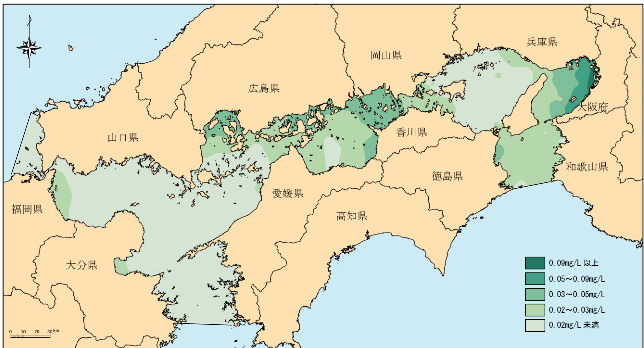
図4-15 令和3年度 全窒素（夏季表層）分布図