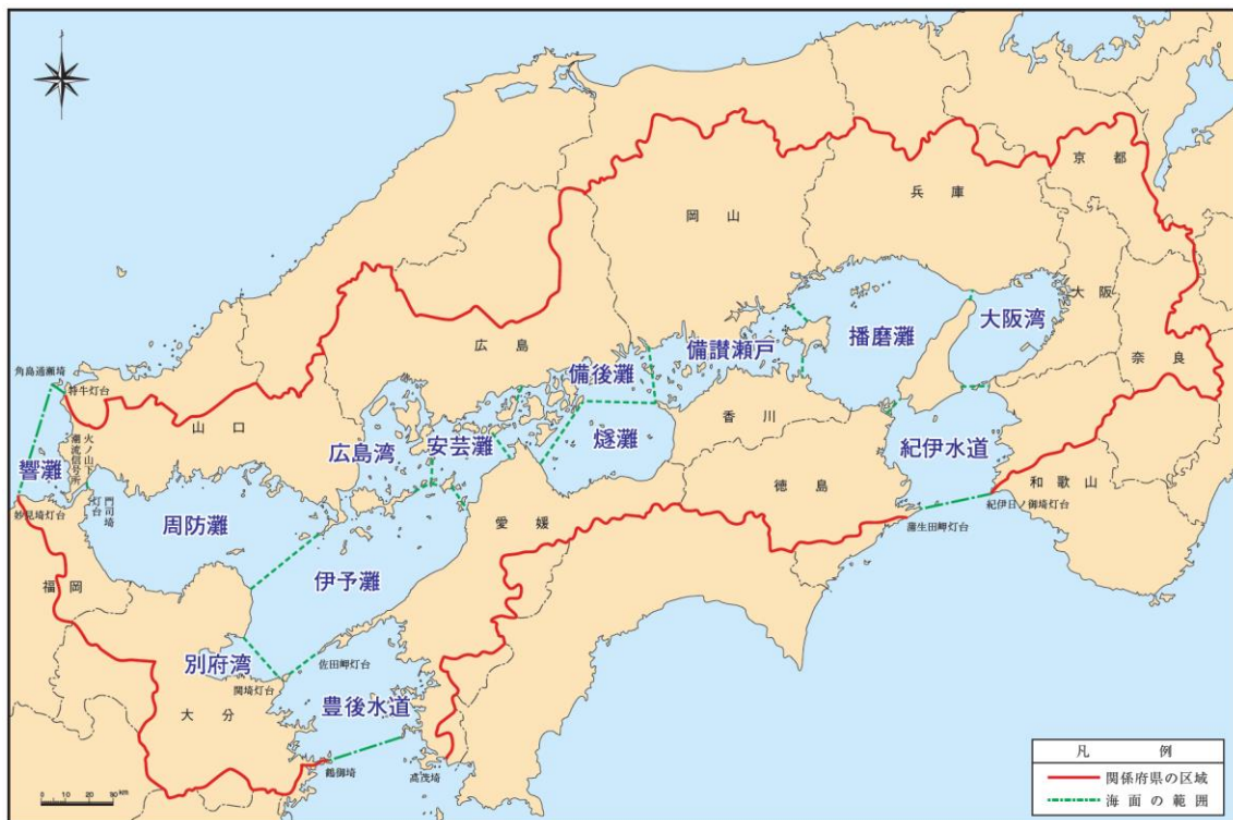
図 1-2 自然環境保全基礎調査による湾・灘区分