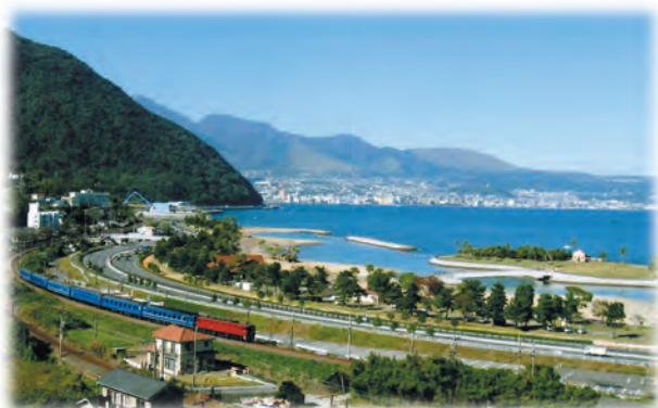
特急富士と田ノ浦ビーチ・高崎山

前回の“瀬戸内海研究フォーラムin大分”は平成15年、『里海』をメインテーマに開催されました。あれから8年 西瀬戸の環境、市民の暮らしや意識等の変化・変遷を考察して、瀬戸内海研究会議が果たした役割を検証しこれからの指針を得ることも重要な目標です。