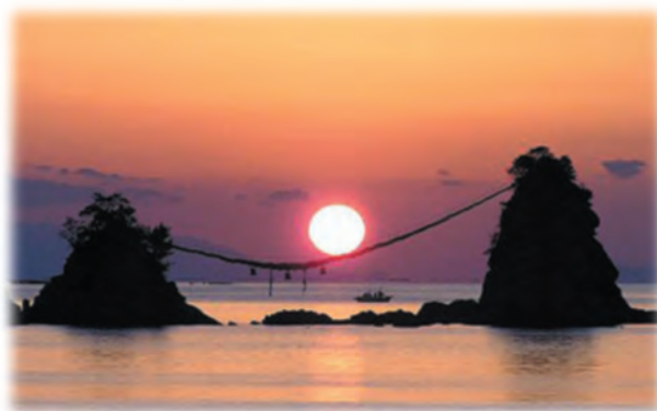
あざむい 浅海井海岸（豊後二見ヶ浦）