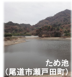
ため池 (尾道市瀬戸田町)