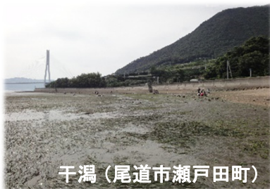
干潟 (尾道市瀬戸田町)