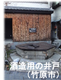
酒造用の井戸 (竹原市)